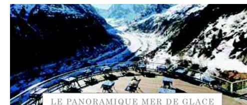
LE PANORAMIQUE MER DE GLACE - bistro avec vue -